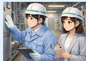
普段は機械を扱うことはありません 汚泥の処理工程は業者へ委託しています

A 印西市及び栄町の家庭などから集められた「し尿及び浄化槽汚泥」を、処理するための施設です。印西地区衛生組合では、新たに「ディスプレイ汚泥」の受入れを開始し「し尿及び浄化槽汚泥」と合わせて高効率脱水機により助燃剤化をし、焼却施設等で再利用する予定です。