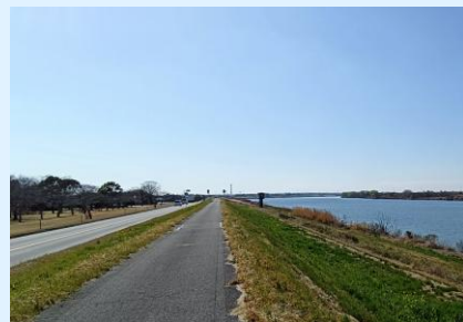
立地は利根川まで徒歩1分。 絶好の散歩、サイクリングコースが隣接しています。

印西地区衛生組合は、印西市と栄町で構成される地方公共団体（一部事務組合）です。下水道が整備されていない地域から排出される「し尿及び浄化槽汚泥」を適正かつ安定的に処理することで、地域の衛生環境と水環境を守る重要な役割を担っています。私たちの仕事は、日常生活の中で意識されることは少ないものの、住民の皆さんが安心して暮らし続けるために欠かすことのできない、「当たり前暮らし」を支える社会基盤そのものです。印西地区衛生組合では、令和9年4月から新たな施設である「汚泥再生処理センター」が稼働します。