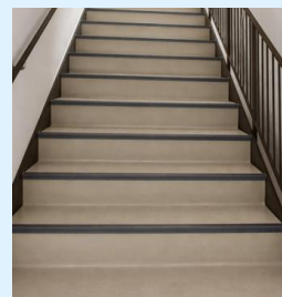
新築の汚泥再生処理センターの階段です

なお、採用後6か月間は条件付採用となりますが、給与や年次有給休暇等の待遇は正規職員と同一です。勤務が良好である場合、正式採用となります。